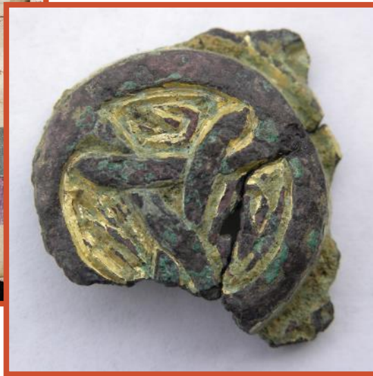
Ci-dessous. Les motifs sont inspirés de l'art des îles britanniques, avec lesquelles la Bretagne entretient d'étroites relations au 9e siècle. Ornement de bronze doré, 8-9e siècle, chapelle de Saint-Symphorien à Paule (22) Ornement bronze, chapelle de St-Symphorien