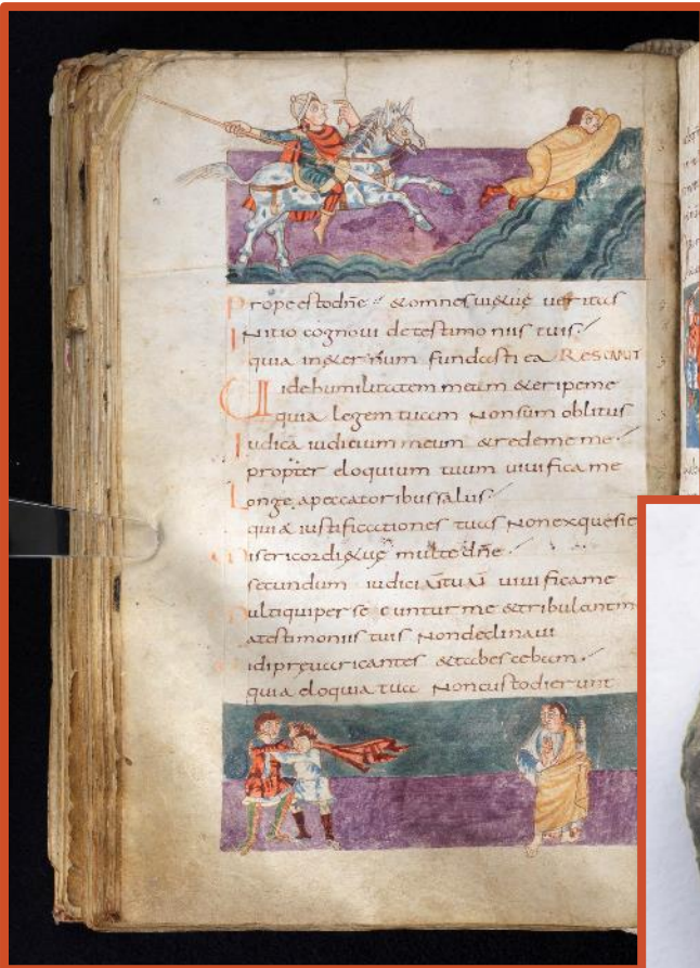
Ci-contre. Psautier Stuttgart. Cavalier armé d'un javelot, Psautier dit de "Stuttgart", produit par l'abbaye de Saint-Germain-des-Prés, 9e siècle © Stuttgart, Württembergische Landesbibliothek, Cod. bibl. fol. 23, f.141v

Régnant sur de vastes territoires, les souverains francs s'appuient sur l'unité de l'Eglise et son influence. Les monastères, en particulier, sont des lieux privilégiés de la diffusion de cette culture « universelle ». A Landévennec, les fouilles de l'ancienne abbaye ont montré l'influence déterminante des modèles impériaux sur l'architecture du lieu. Les manuscrits bretons et d'autres objets d'art religieux témoignent d'une vie culturelle ouverte à des influences multiples : impériales, mais également méditerranéennes, irlandaises ou britanniques.